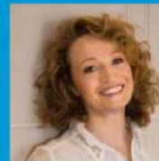
Annick Cojean Femmes, Paix et Sécurité