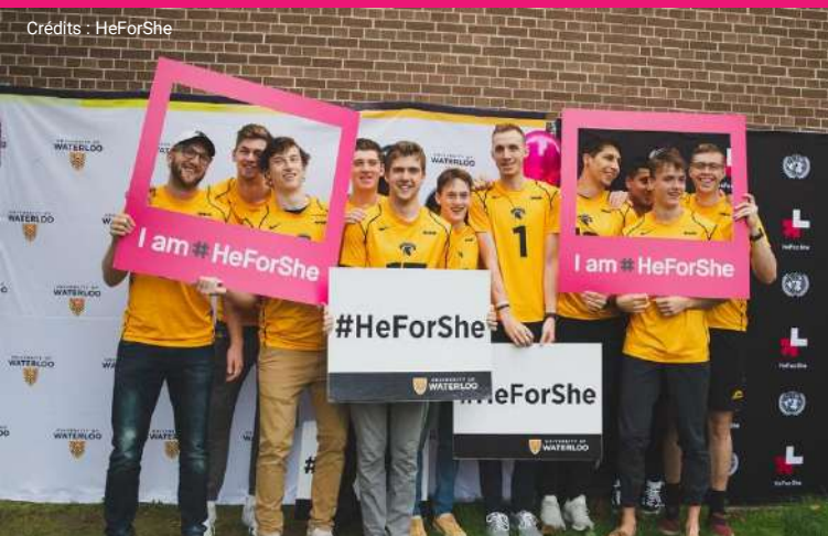
*HeForShe à la maison