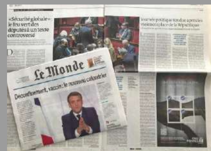
Les médias partenaires