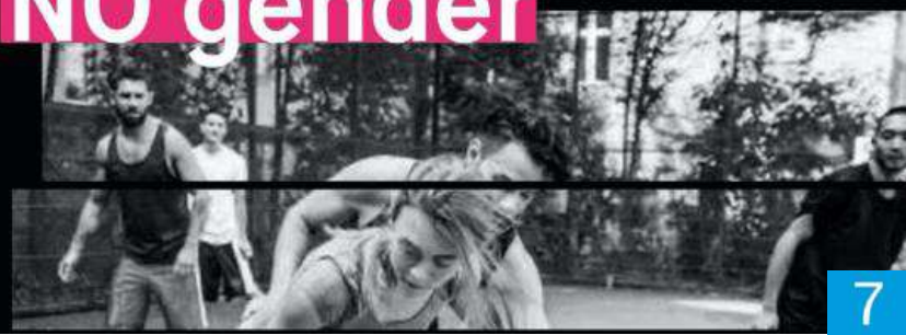
*Le sport n'a pas de genre

HeForShe Fédération HeForShe Enseignement Supérieur