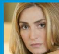
Julie Gayet Orange Day